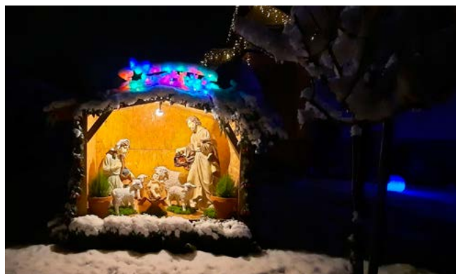
Autor - Sebastian Frączek

Wyróżnienie w kategorii „najładniejsza fotografia” powędrowało do Pana Sebastiana Frączka .