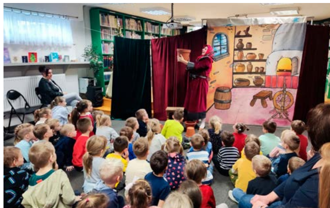
Przedstawienie teatralne w bibliotece