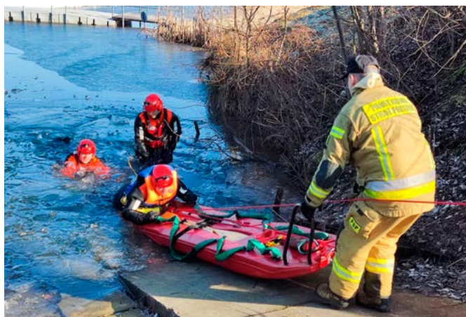
Ćwiczenia PSP w Kaniowie

Osobom, pod którymi załamał się lód, w wielu przypadkach są w stanie pomóc świadkowie zdarzenia. Jeśli zachowają szczególną ostrożność, mogą wykorzystać przedmioty znajdujące się pod ręką – np. szalik, długą grubą gałąź, kij hokejowy czy sanki. Wybierając się na zamrożone akweny, przeczornie warto wziąć ze