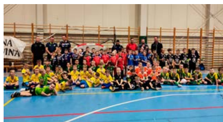
Podsumowanie rozgrywek – grupa „Skrzatów”

Seniorzy – babcie, dziadkowie, a może także prababce i pradziadkowie również interesują się futbolem, a poczynania najmłodszych latorośli przypominały im czasy, gdy sami grali w „nogę” i przeżywali największe sukcesy polskiego piłkarstwa. Jak już jednak wielokrotnie pisaliśmy – wyniki są w przypadku dzieci i młodzieży rzeczą drugorzędną. Owszem – zdobyty medal cieszy, lecz jeszcze więcej radości sprawia nabywanie umiejętności, integracja z drużyną, nauka zasad fair play.