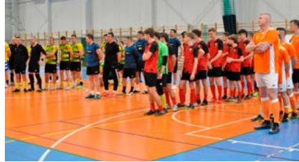
Drużyny biorące udział w Memoriale