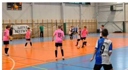
Mecz w kategorii młodzików