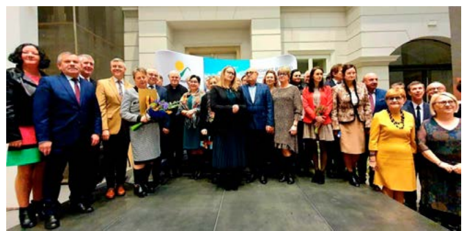
Wspólne zdjęcie wyróżnionych twórców i animatorów kultury

Oto krótka charakterystyka laureatów z gminy Bestwina: