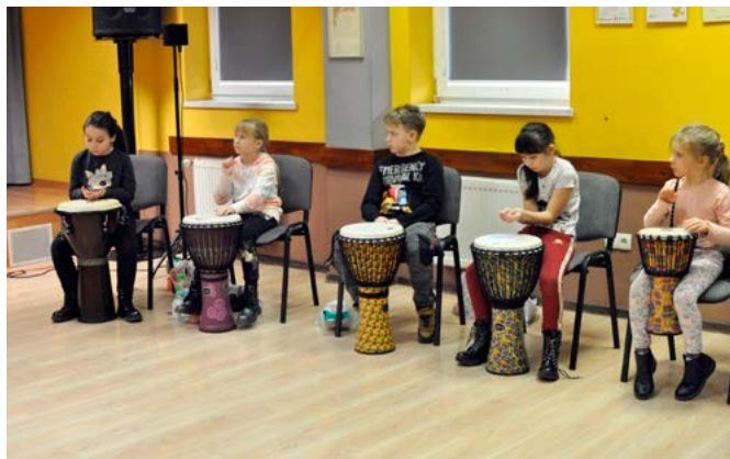
Zajęcia muzyczne w sali widowiskowej GOK

i muzyczne, z wykorzystaniem instrumentów perkusyjnych. Dzieci wykazujące talenty plastyczne mogły wykonać kubki na zimową herbatę, torby, wspaniałe obrazy i tajemnicze „magiczne drzewo z mchu”. Akcent regionalny to malowanie drewnianych kogucików, tradycyjnej zabawki spotykanej dawniej na naszych terenach.