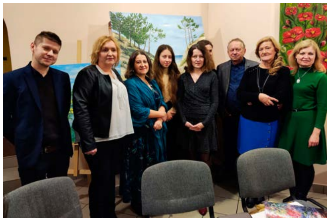
Członkowie grupy „Jaskółka” na tle obrazów

Każdy z autorów w kilku słowach opowiedział o sobie, swoich osiągnięciach i poszukiwaniach artystycznych. Wypowiedziom przysłuchiwali się przybyli na wernisaż goście, w tym ksiądz