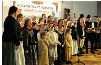
Regionalny Zespół Pieśni i Tańca „Bestwina”

muzycy związani od wielu lat z RZPiT Bestwina. W dalszej kolejności przyszedł czas na kapelę góralską Zbójnicy . Goście ze Szczyrku w grudniu zawitali na Piknik Bożonarodzeniowy do Kaniowa, a w Bestwinie koncertowali z muzyczną wiązką typową dla terenów górskich. Przywieźli z sobą dudy żywieckie – solowy popis na tym instrumencie wywołał gromkie oklaski.