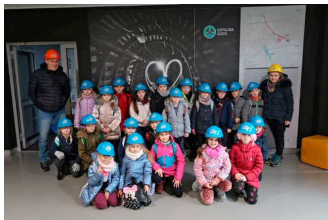
Wizyta w kopalni „Guido” w Zabrze

„Kozia Zagroda” w Brennej to miejsce, które przybliżyło wycieczkowiczom życie naszych czworonożnych przyjaciół, kiedyś obec-