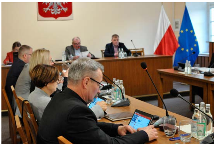
Dyskusja i podejmowanie uchwał